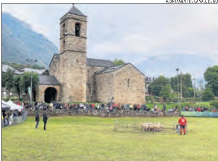
AJUNTAMENT DE LA VALL DE BOÍ

Barruera va acollir ahir la jornada tècnica Gure Sheepdog Trail, dedicada als gossos pastors. Va incloure tallers i demostracions de treball real amb el maneig de vaques, xarrades sobre diferents races de gossos, tant de pastor com de protecció. Es va celebrar en el marc de la fira ramadera, que avui acollirà una desena de productors i més tallers.