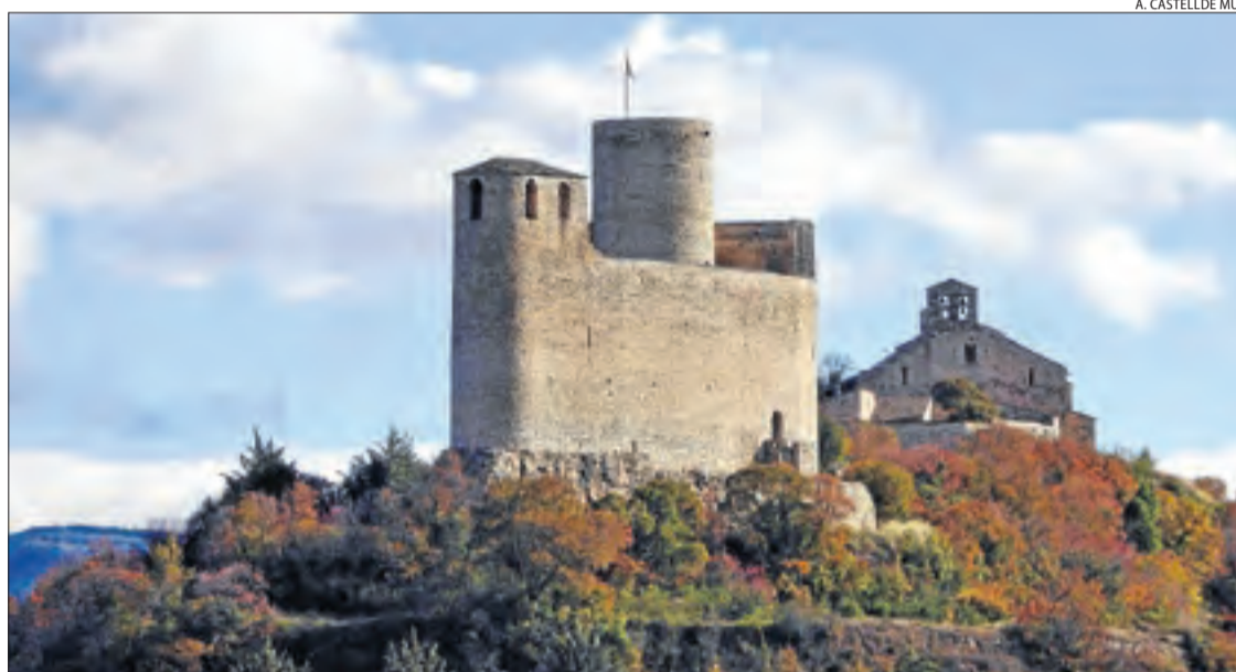
En aquests dos primers anys s'han dut a terme obres d'arranjament en carrers, camins o enlluminat.

Un segon projecte es vincula a l'activitat agrària. "Un 30 o 40% de la terra de cultiu es concentra a la zona sud del poble, però els tractors i altres tipus de maquinària per treballar han de passar pel mig del poble". Per tal d'evitar el trànsit, "la idea és fer una altra circumval·lació per accedir a la zona de cultiu rústica, de manera que es desviï el pas de la maquinària pel centre del nucli", explica Mullol. El projecte, que afectaria un tram