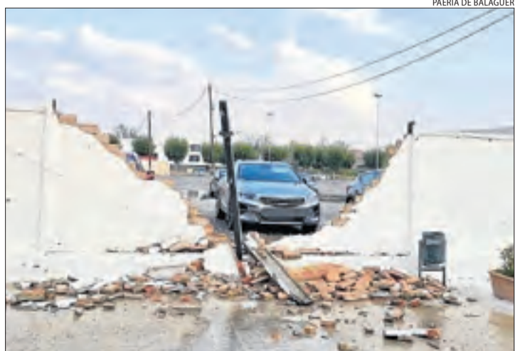
Un mur va cedir després de la tempesta a Balaguer.