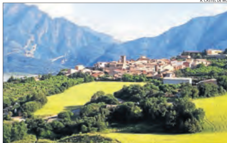
Guàrdia de Noguera és el nucli principal.

Passada l'etapa més severa de la pandèmia, ara toca reactivar l'economia. I a escala municipal s'hi pot actuar força. A l'hora d'emprendre obres com les contemplades al PUOSC, "fem un esforç perquè contractistes i treballadors siguin de la comarca, de manera que al final tot es queda aquí. Tot el que tira endavant l'ajuntament en matèria de projectes i millores reverteix directament en el municipi i el Pallars", apunta. "Els ajuntaments aporten molt i els contractistes ho saben. A