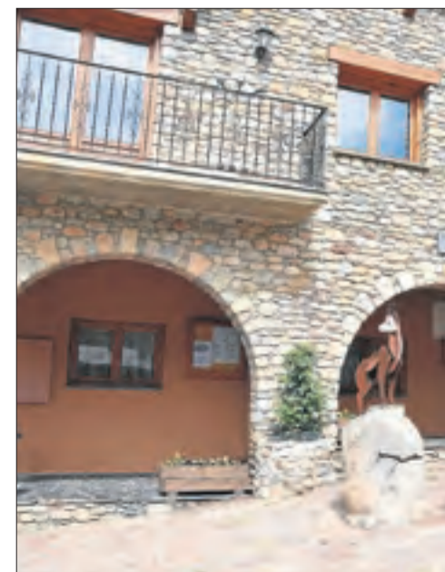
L'alcalde, Miquel Pons (centre), amb alguns