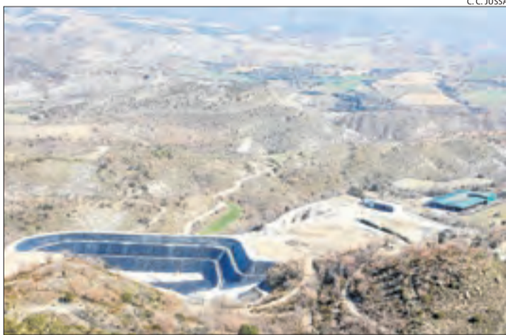
C. C. JUSSÀ