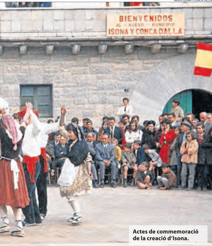
Actes de commemoració de la creació d'Isona.