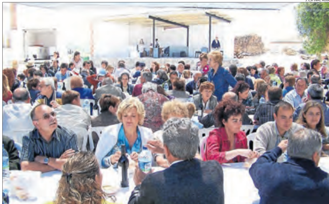
Imatge d'arxiu de la inauguració de reforma de l'ermita de Santa Fe de Tudela, l'any 2005.

Sant Romà d'Abella, Orcau i Basturs i Figuerola d'Orcau. El primer ajuntament va estar dirigit per Josep Solans. El 1984 el municipi va canviar de nom i va passar a dir-se Isona i Conca Dellà, una denominació més d'acord amb la toponímia catalana. Aquell mateix any també es va crear l'escut local amb dos fonts d'aigua de l'escut tradicional d'Isona i vuit roses daurades procedents de l'escut d'armes dels Orcau. El 1991 es va crear la bandera amb els mateixos criteris. En aquests cinquanta anys, ha tingut seixanta-cinc