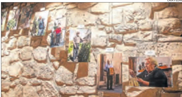
'L'Essència de Rocafort' mostra veïns de més de 65 anys.

A Rocafort de Vallbona, alguns veïns recorden l'agregació a Sant Martí de Maldà, municipi que aleshores va passar a nomenar-se Sant Martí de Riucorb, com un "embolic" de les autoritats polítiques del moment, ja que la unió de municipis estava premiada amb diners. Asseguren que si s'hagués convocat una consulta popular, més d'un 90 per cent dels veïns hi hauria votat no perquè, al passar a ser agregats d'una altra localitat, hi van perdre més que van guanyar. Assegu-