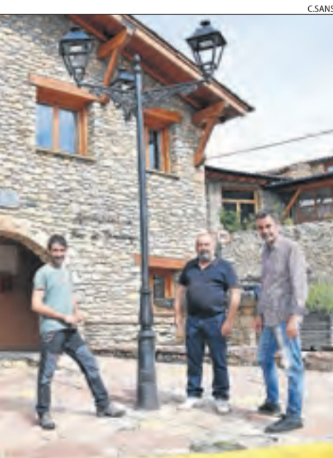
dels veïns de Riu.

portada de l'aigua a canvi d'anexionar-se a Artesa. I així ho van fer, encara que finalment les obres les van fer a jova (de manera voluntària) veïns de les tres localitats. Van ser ells els que van executar una xarxa de distribució, el clavegueram i la captació des del riu fins als tres dipòsits d'emmagatzematge. L'única ajuda que van rebre per part de l'administració va ser el material per als treballs. Es van prolongar fins aproximadament al 1975, quatre anys després d'agregar-se a Artesa de Segre, el 1971. Josep Blanch va ser l'alcalde en aquella època i actualment una plaça del poble exhibeix una placa en la seua memòria.