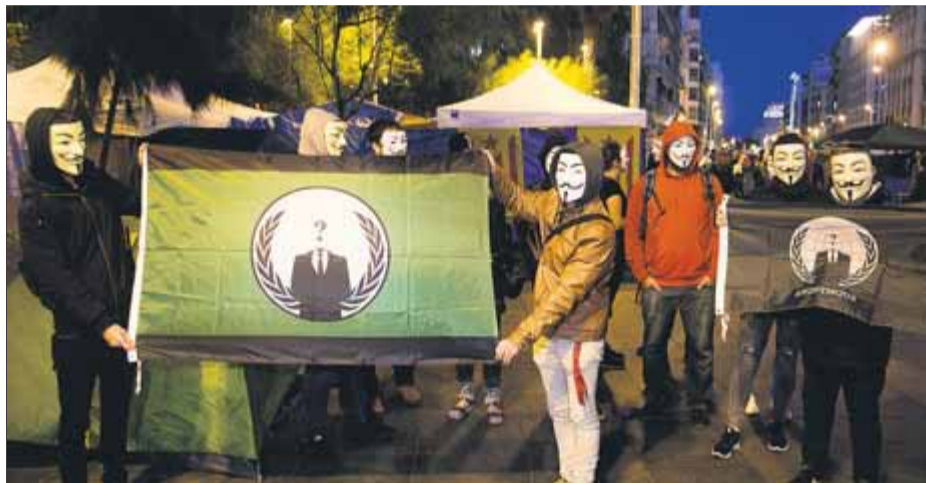
Aquesta acció del novembre del 2019 també ha estat investigada pels Mossos

La investigació, avançada ahir per aquest diari, arrenca d'una denúncia presentada per la fiscalia el 2019 en què vincula el moviment Anonymous amb la "tardor calenta" del 2019 i les protestes post-sentència del Tribunal Suprem. A Anonymous Cata-