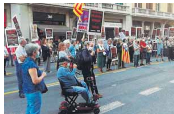
Unes dues centes persones van secundar la convocatòria d'ahir i es van concentrar a la Via Laietana ■ JPF

té com a objectiu atacar interessos de l'Estat espanyol per desestabilitzar i afavorir la independència de Catalunya". ■