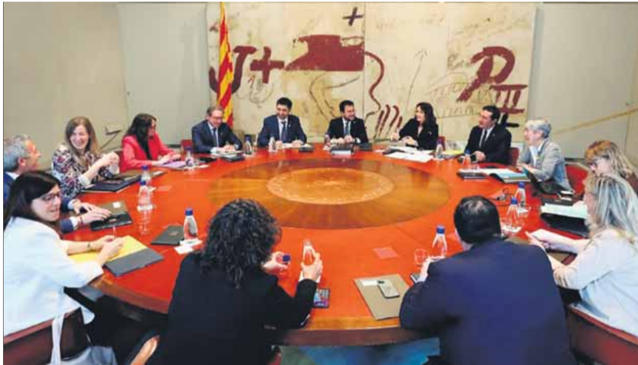
El consell executiu d'ahir al matí a Palau, que va començar amb cert retard per les reunions prèvies