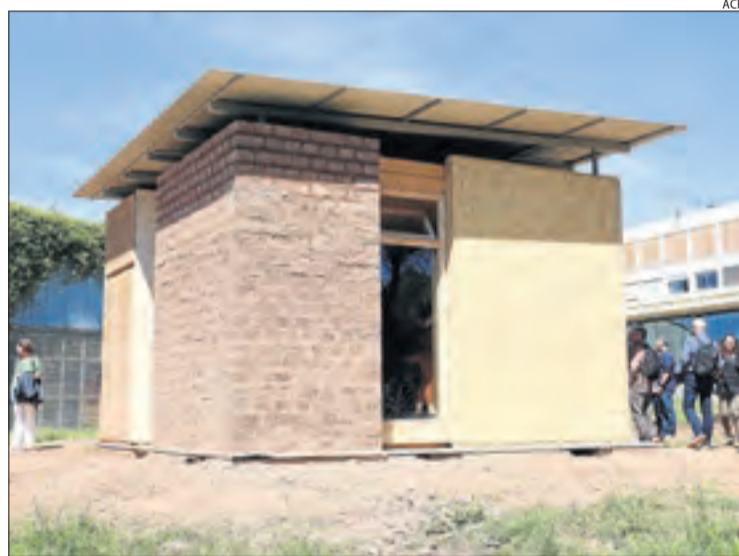
La casa a Sant Cugat construïda amb tiges de panís de Miralcamp.

Els promotors d'aquesta instal·lació van sembrar els terrenys per proporcionar aliment als animals, mentre que les plaques fotovoltaïques els proporcionen ombra i refugi. Altres projectes en curs a les comarques lleidatanes plantegen unir la generació d'electricitat amb activitat agrària.