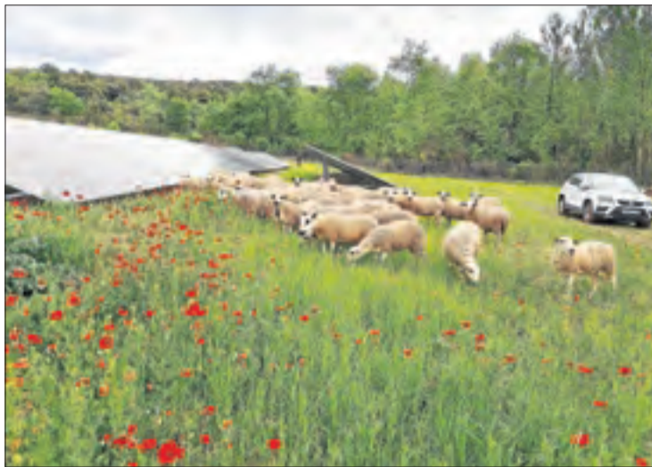
Un ramat d'ovelles entre panells solars a Talarn.

Contractar quatre enginyers suposaria duplicar el personal dedicat a tramitar aquesta mena de projectes. Fonts de la conselleria van atribuir l'absència de candidats al fet que és un perfil professional escàs i que troba condicions més atractives en el sector privat. Van descartar augmentar la retribució en la nova convocatòria d'ocupació, a