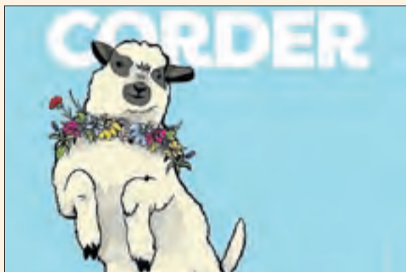
Cartel·l d'aquesta edició de la fira gastronòmica.

Amb un esmorzar popular a base de girella, Tremp obre la fira Pallars, Terra de Corder. Després, inauguració oficial amb l'actriu Ivana Miño, ambaixadora d'aquesta edició, activitat comercial i tallers entorn de la gastronomia, animació amb la colla de diables Lo Peirot i el Cabaret pagès amb l'Esperanceta d'Esterrí d'Àneu. Al migdia, cercavila i tast de formatges d'ovella i, a la tarda, escape room, tallers artesans i obertura de la Pallars Food Fest, amb música en directe fins a la matinada.