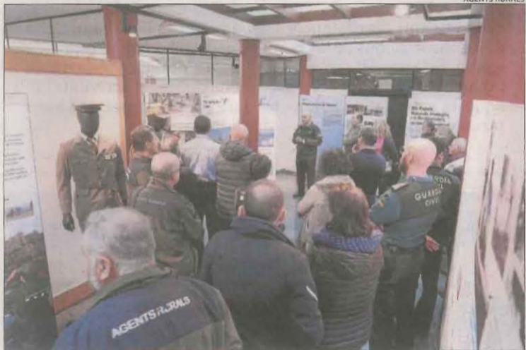
La inauguració de l'exposició, a l'Epicentre de Tremp.