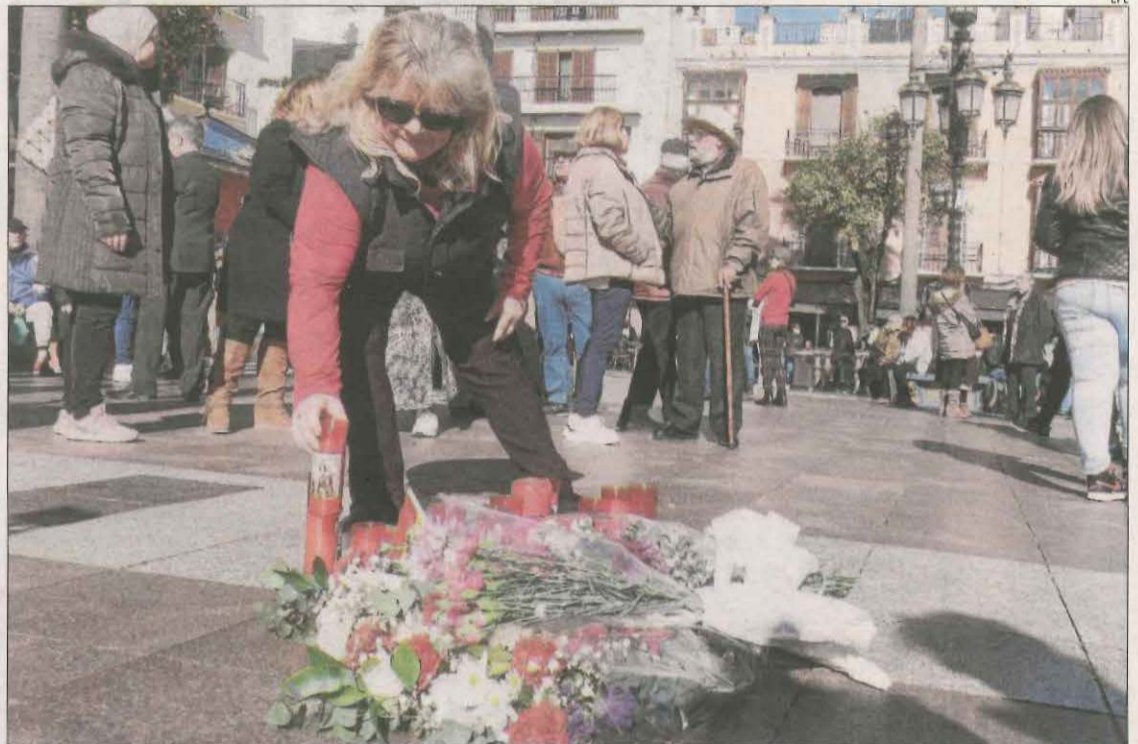
Una dona col·loca una espelma al lloc en el qual es va produir dimecres l'atac a Algesires.

de Mossos Uspac va registrar aquest dimecres un escrit dirigit al director general de la policia catalana, Pere Ferrer, en què demana mesures urgents per l'increment exponencial de violència als espais públics i mitjans de transport de tot Europa durant aquest mes". Així doncs, a part de l'atac a Algesires, el sindicat va recordar l'atac a l'es-